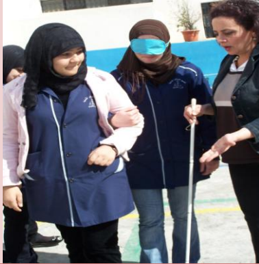
يوم توعية في إحدى المدارس