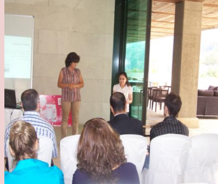
ورشة عمل موجهة إلى أطباء الأسنان