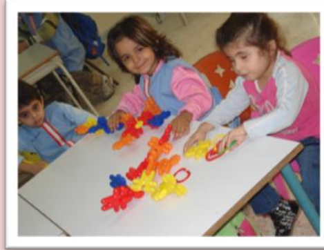
إحدى الطالبات في المدارس الداخمة