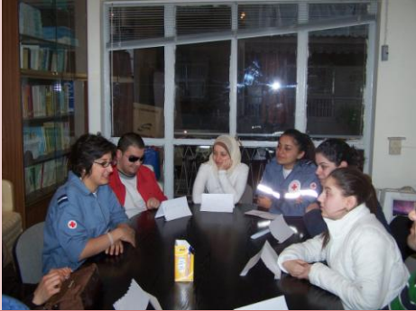
مع الصليب الأحمر اللبناني